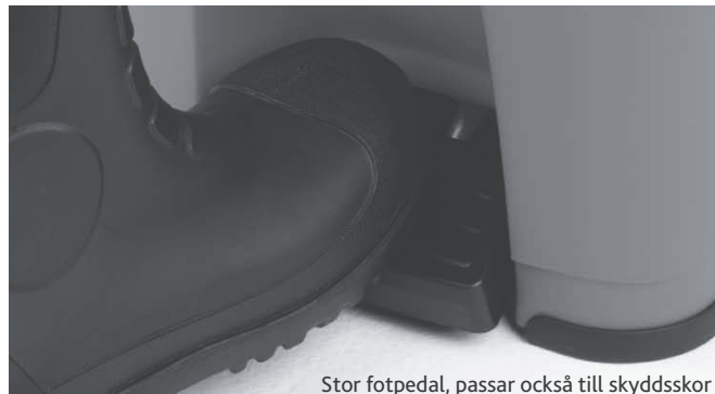
Stor fotpedal, passar också till skyddsskor