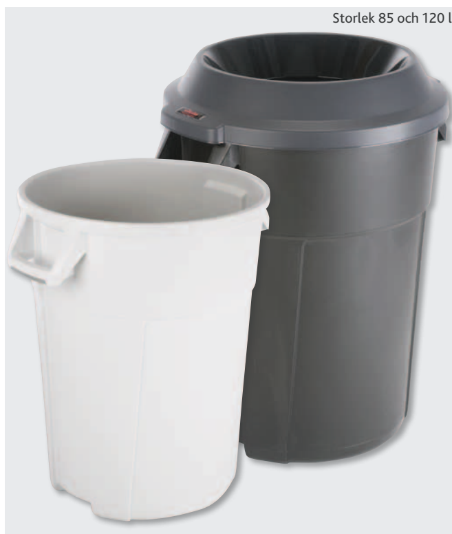
Storlek 85 och 120 l