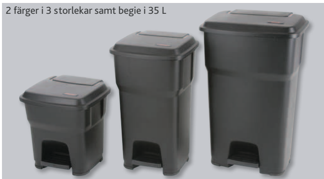
2 färger i 3 storlekar samt begie i 35 L