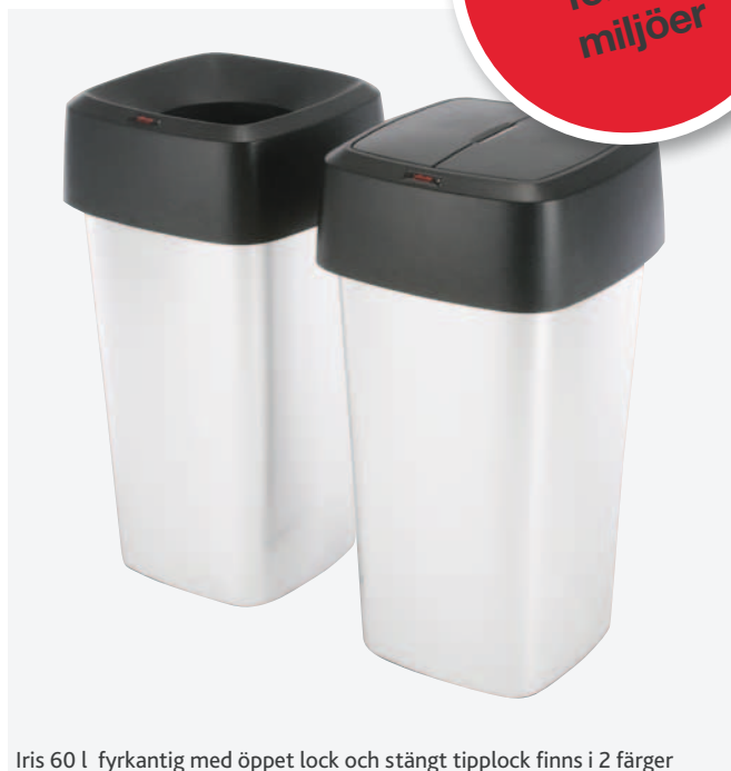
Iris 60 l fyrkantig med öppet lock och stängt tipplock finns i 2 färger

Integrerad hållare för sopsäck – perfekt passform