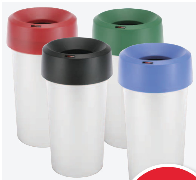
Iris 50 l rund med öppet lock finns i 5 färger