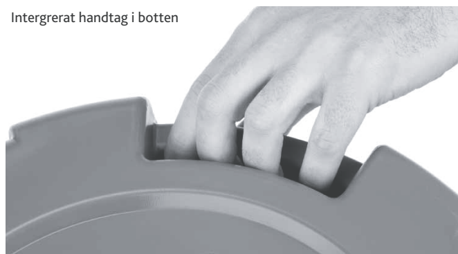
Integrerat handtag i botten