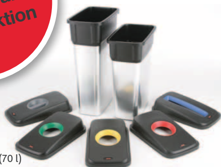
Geo – stor (70 l) och medium (55 l) med lock för sopsortering

Toppklass i design, kvalitet och funktion